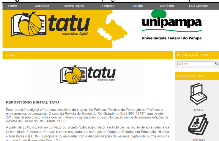
Imagem 02: Print Screen da página inicial do novo Repositório Digital.